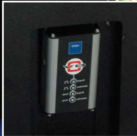
Emplacement pour VDC