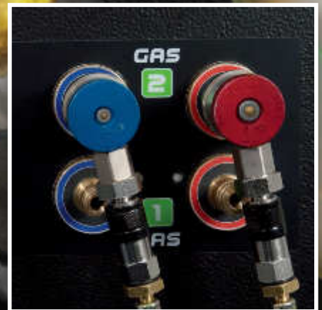
Doubles attaches du gaz réfrigérant (uniquement sur 780R)