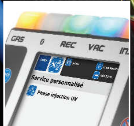
Indicateur lumineux d'état