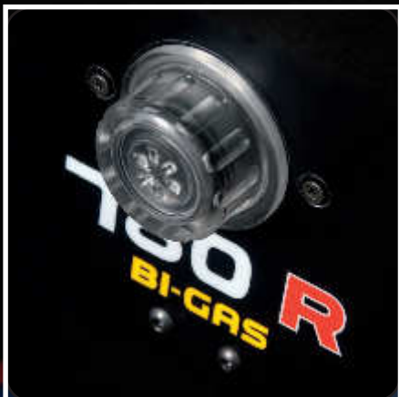
Identifiant de gaz